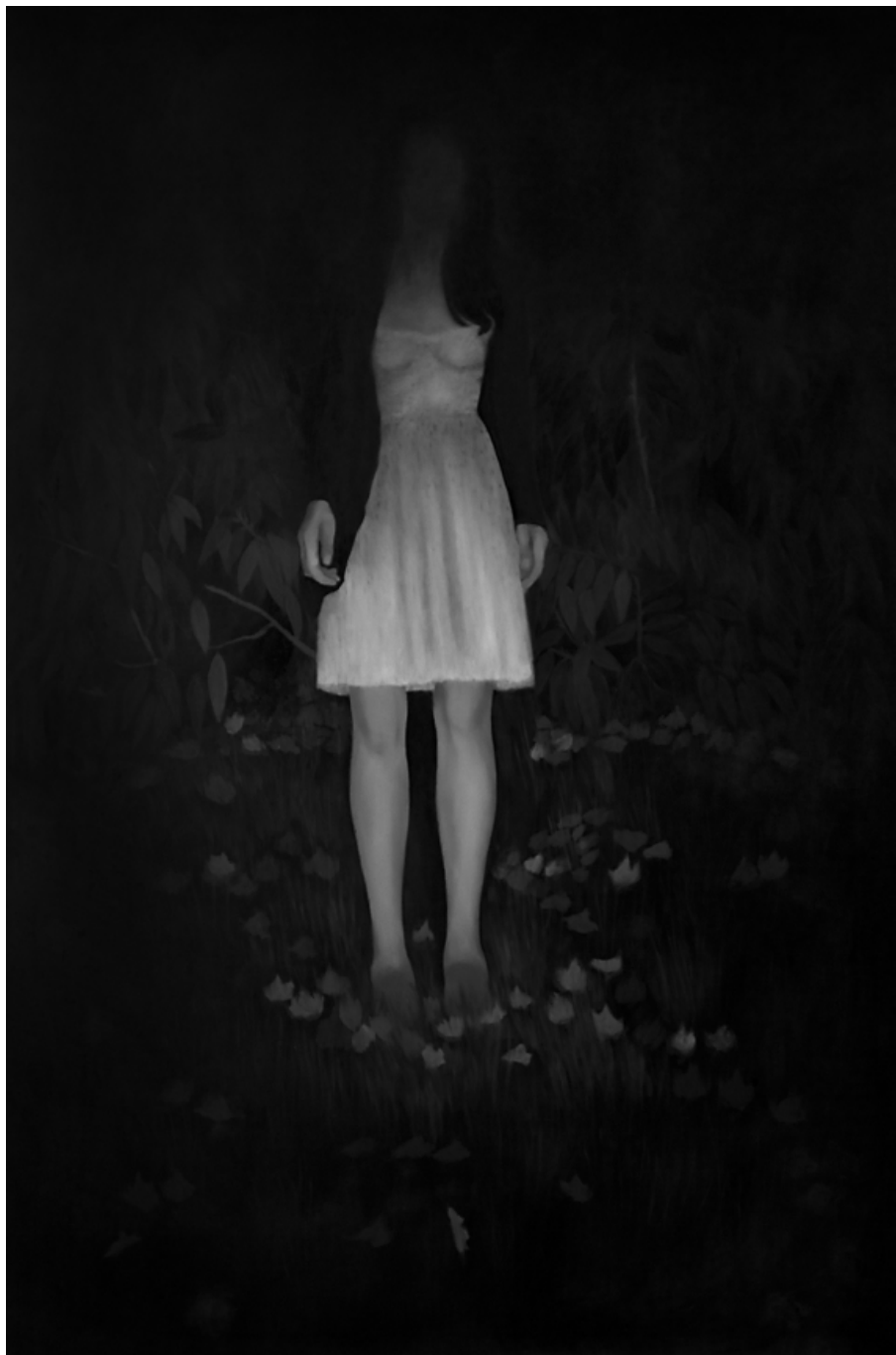
1) Без Назива, 2011 – 200 x 140 cm – уље на платну