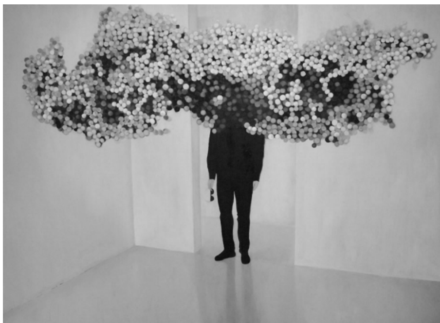
Без Назива, 2010 – 120 x 180 cm – уље на платну