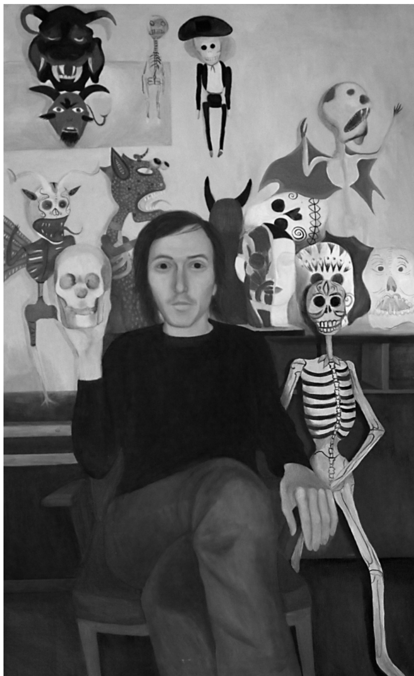
Портрет Fredox-a, 2011 – 120 x 80 cm – уље на платну