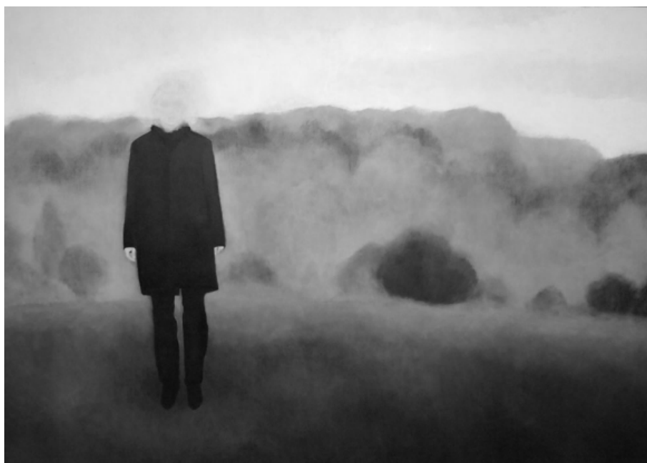
Без Назива, 2010 – 120 x 180 cm – уље на платну