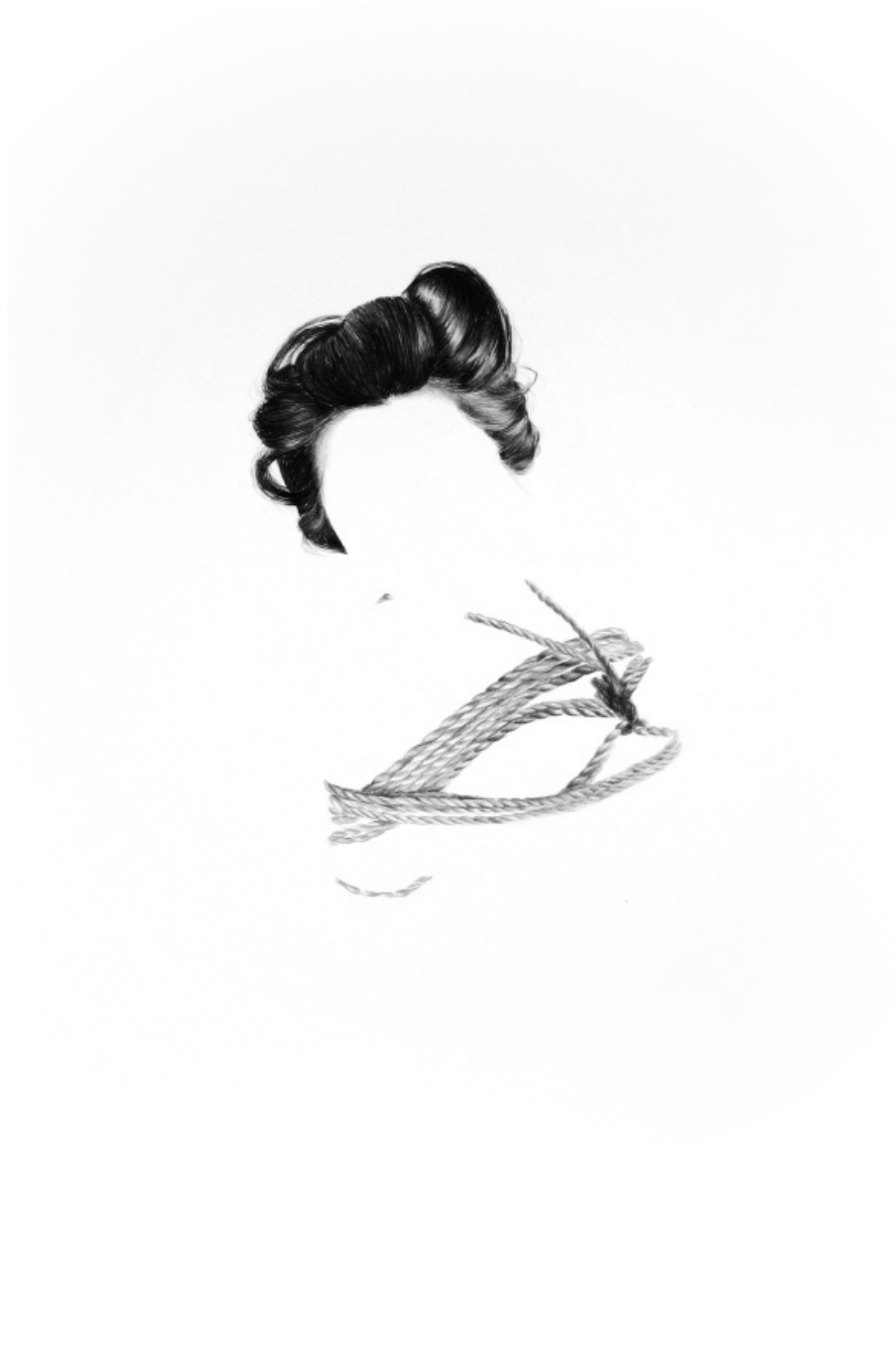
Без Назива, 2010 – 50 x 35 см – графит на папиру