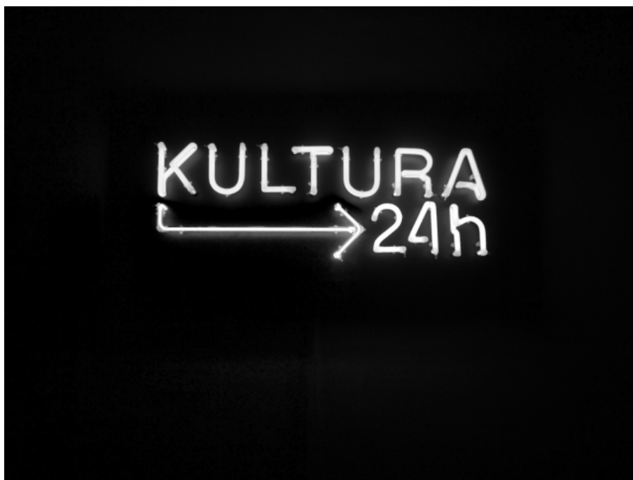
Култура NON-STOP, 2012, неонске цеви

Овај рад поставља питање положаја човека као јединке у данашњим културним и социјалним оквирима. Култура NON-STOP на ироничан начин говори о одсуству културе и културних институција у овом граду и овој земљи. Коришћењем неонских цеви прави се визуелна аналогија са светлосним рекламама којима смо бомбардовани, које свакодневно, свесно или подсвесно, запажамо у градском окружењу.