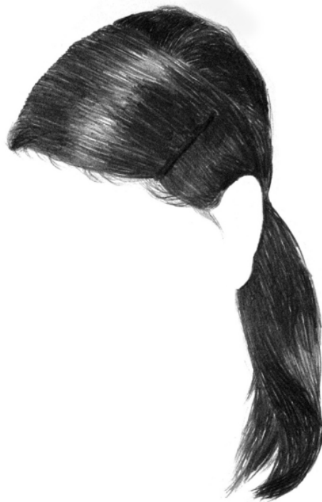
Без Назива, 2010 – 50 x 35 cm – графит на папиру