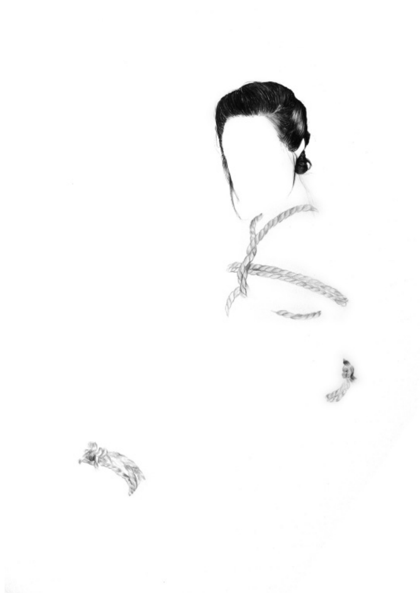
Без Назива, 2010 – 50 x 35 cm – графит на папиру