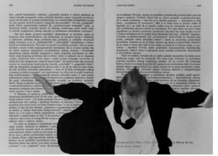
Panic Book, video animacija, 2013