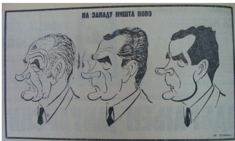
(8) „На западу ништа ново“, В. новости , 18. новембар 1968, 2 (Р. Гузина).