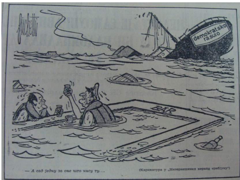
(3) Џонсон: „А сад једну за оне што нису ту...“ (на броду: демократско расуло), Борба , 1. октобар 1968, 3.