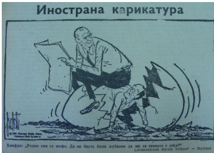
(2) Хамфри: „Родио сам се шефе. Да ли бисте били љубазни да ми се скинете с леђа?“, Борба , 3. август 1968, 3 и Политика , 18. август 1968, 6.