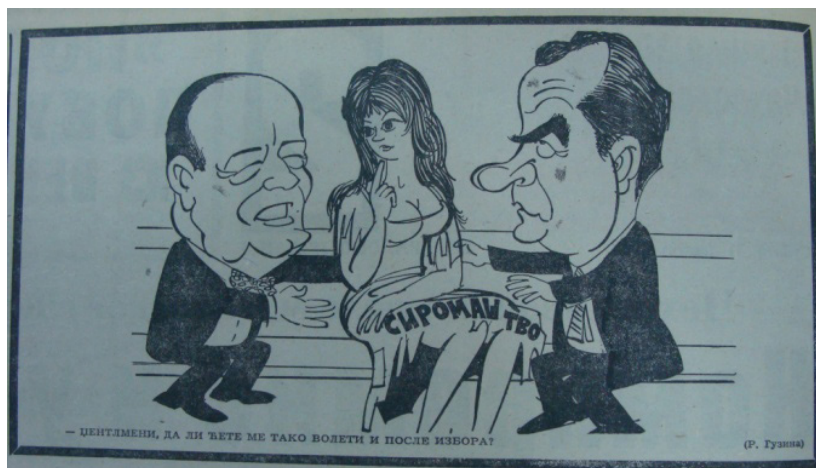
(6) Сиромаштво: „Џентлмени, да ли ћете ме тако волети и после избора?“, В. новости , 31. август 1968, 2 (Р. Гузина).