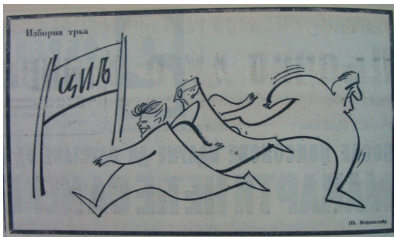
(5) „Изборна трка“, Вечерње новости , 2. април 1968, 2 (П. Кораксић).