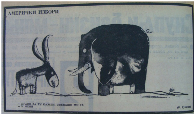
(7) Амерички избори: „Право да ти кажем, свеједно ми је. – И мени.“, В. новости , 6. новембар 1968, 2 (Р. Гузина).