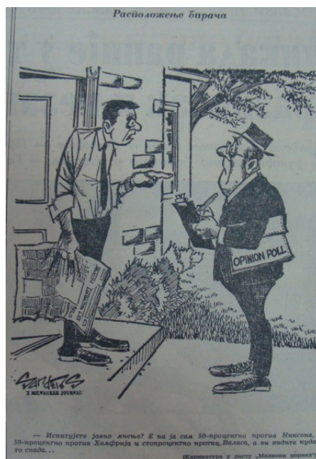
(4) Расположење бирача: „Испитујете јавно мњење? Е па ја сам 50-процентно против Никсона, 50-процентно против Хаамфрија и стопроцентно против Валаса, а ви видите где то спада...“, Борба , 21. октобар 1968, 3.